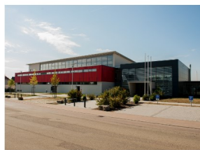
Mehrzweckhalle Schulstraße 13, 74572 Blaufelden